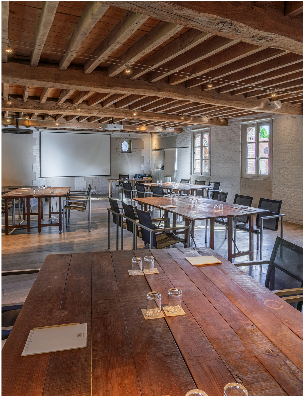
LA PLENIERE MOULIN